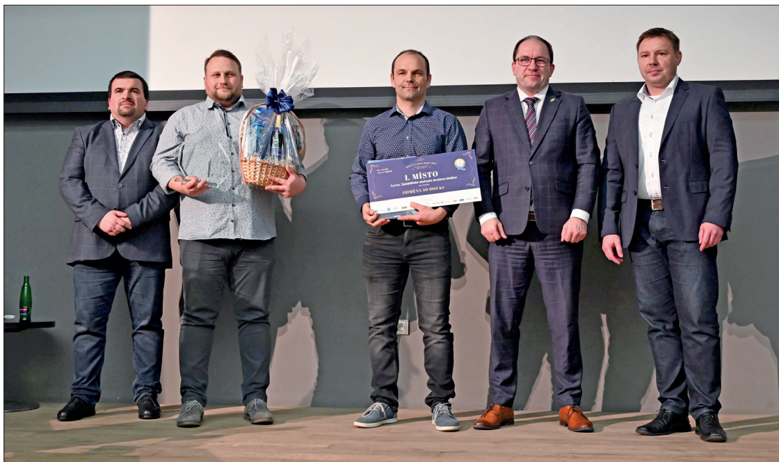
První místo v kategorii HOLŠTÝN – Zemědělské obchodní družstvo Mrákov

českého strakatého skotu byla pro tento ročník akciová společnost PROAGRO Radešínská Svatka, farma Řečice, která měla také 100 bodů, ale o něco horší pořadí laktace než farma na místě čtvrtém.