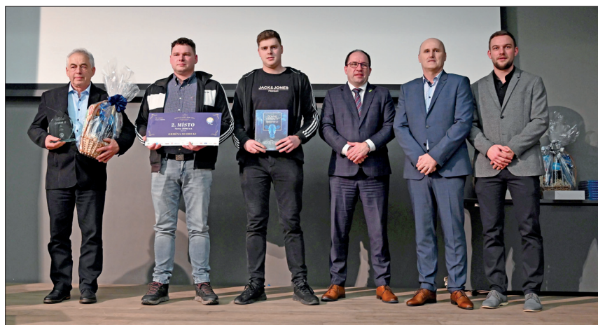
Stříbro v kategorii HOLŠTÝN – ZERAS, a. s., stáj v Pavlově

V kategorii HOLŠTÝN se vybíralo z 519 farem zapojených do kontroly užitekosti. Zlato vybojovalo v takové konkurenci ZOD Mrákov, konkrétně farma v Tlumačově se ziskem 108 bodů, která není na stupních vítězů nováčkem. Pořadí laktace 2,36. Stříbro obsadila stáj v Pavlově akciové společnosti ZERAS Radostín, bodový zisk v základních kategoriích byl také 108, pořadí laktace 2,28. Třetí místo získala stáj v Bohdalově, a. s., AGRAS Bohdalov, se 106 body. Akciová společnost LUKA vybojovala v holštýnském plemeni čtvrté místo, její VKK