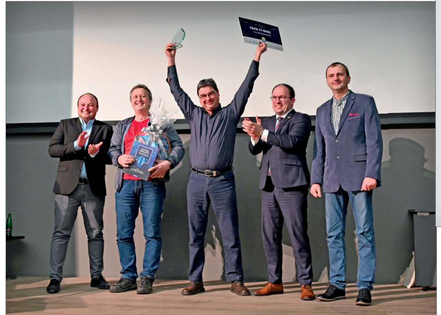
Skokan roku v kategorii ČESTR – Rolnické družstvo Krouna, farma Krouna

meziročně zlepšila nejvíce. Podmínkou bylo přihlášení farmy do soutěže Mléčná farma v minulém ročníku a vyhodnocování v ročníku letošním, což splnilo 76 farem v kategorii ČESTR a 99 farem v kategorii HOLŠTÝN. Posuzována byla u jednotlivých podniků procentní změna u všech šesti hodnocených ukazatelů. Následně u každého parametru bylo mezi podniky stanoveno pořadí podle toho, jak velká byla meziroční procent-