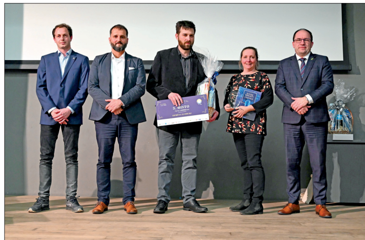
Třetí místo v kategorii ČESTR – Lukrena, a. s., VKK Řeňče