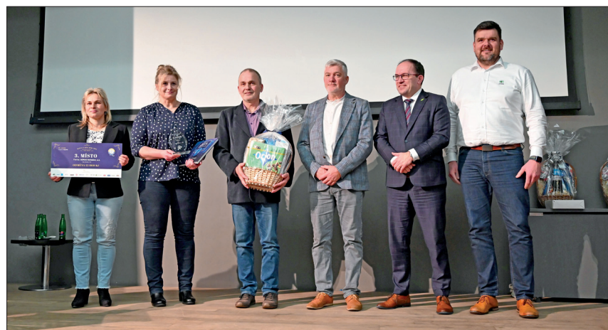
Bronz v kategorii HOLŠTÝN – AGRAS Bohdalov, a. s., Bohdalov VKK