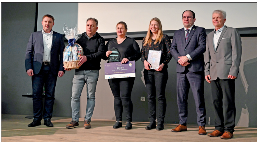
Druhé místo v kategorii ČESTR – akciová společnost Podorlicko, mléčná farma Verměřovice

Na stříbrné příčce se umístila a. s. Podorlicko, konkrétně mléčná farma Verměřovice se ziskem 104 bodů. Bronz letos obdržela farma Řeňče a. s., Lukrena, která měla na svém kontě pro letošek 103 bodů. Na čtvrté pozici skončil již tradiční účastník a výherce soutěží ZAS Horní Bradlo, konkrétně farma Javorné s bodovým ziskem 100. Pátým chovatelem