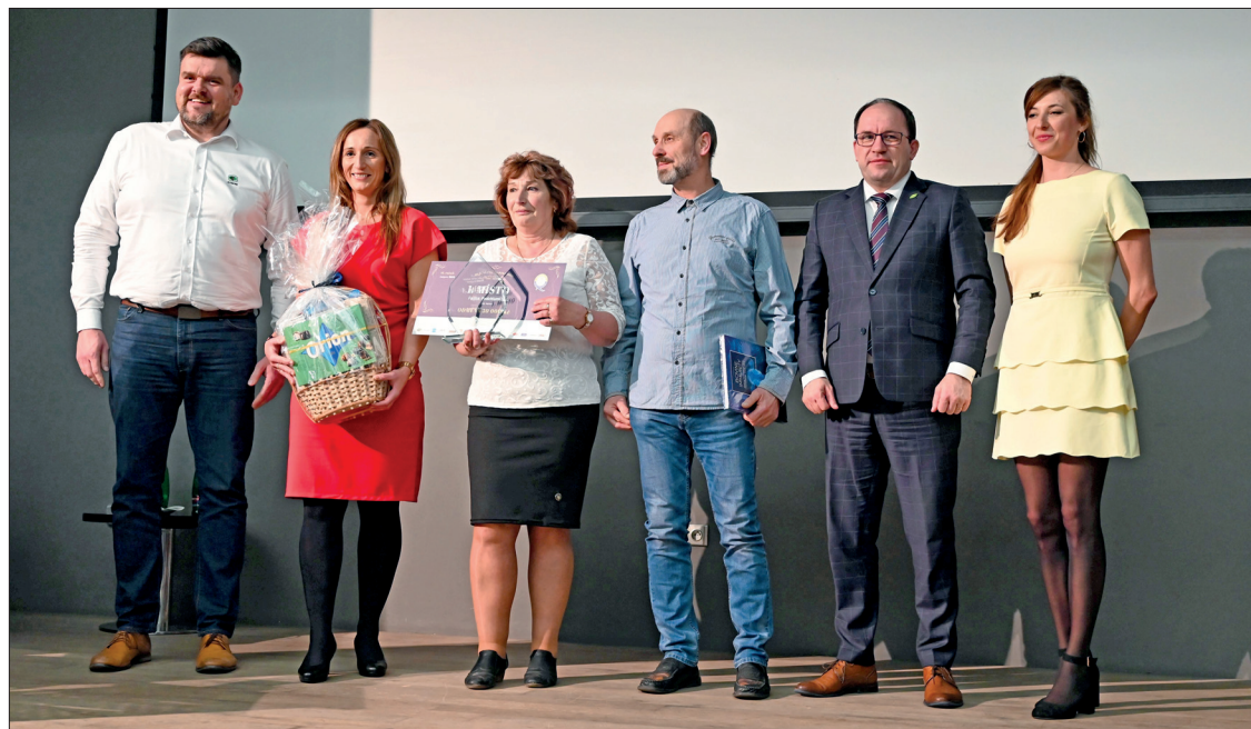
Zlato v kategorii ČESTR – akciová společnost Podchlumí, farma Hejnice